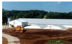
Desechos de ganado